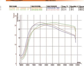
Proven through Dynotest that the power and torque of Eco Racing defeated the Foreign Octane Booster products.