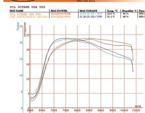
The test on Honda CBR 250 cc, Eco Racing showed the power and torque increase surpassing the American Octane Booster Pil